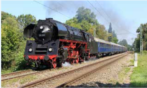
01 519 (EFZ e.V.)