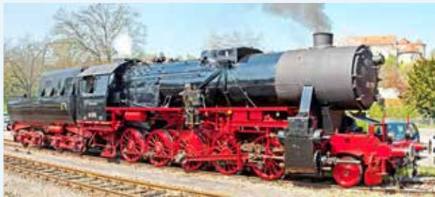
52 7596 (EFZ e.V.)